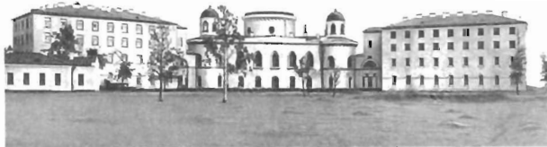
Ю. М. Фельтен. Чесменский дворец

Чесменский дворец был построен треугольным в плане с центрально расположенной башней и тремя небольшими башенками по углам. По своему