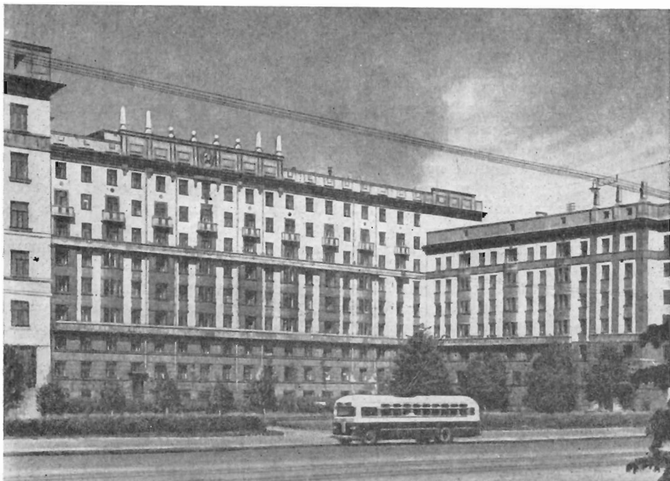
Жилой дом на Московском проспекте (на месте, где было Горячее поле).