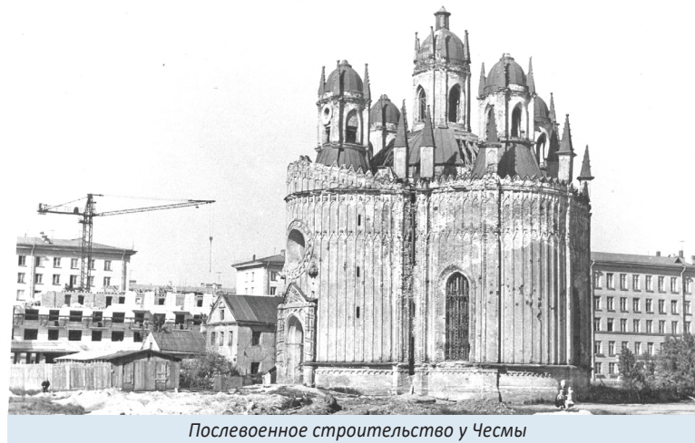
Послевоенное строительство у Чесмы

Её восстановлением почти не занимались, наоборот, были планы разобрать церковь на плитку и бутовый кирпич для Автодорожных мастерских. Но для разрушения храма надо было ехать в Москву, чтобы снять охранный статус здания. Никто не поехал, сносить не стали. Долгое время храм стоял заколоченным.