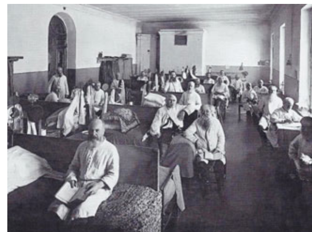
Бывшие воины русской армии, призреваемые в Чесменской богадельне

Весной 1826 года опасющийся восстаний император Николай I приказал перевезти в Рождественскую церковь дворца из Царского села мертвое тело брата — императора Александра I. Именно здесь в ночь с 5 на 6 марта труп августейшей особы переложили из еще таганрогского деревянного гроба в новый, бронзовый, укрыли бездыханного царя мантией и поставили саркофаг на траурную колесницу,