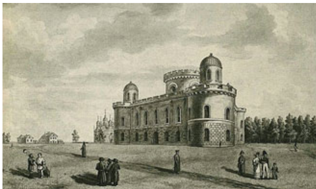
Вид Чесменского дворца. Неизвестный художник. Рисунок пером. Конец XVIII века

Дворец в плане представляет собой равно-сторонний треугольник, углы которого выполнены в виде башен, завершающихся фонарями с полусферическими куполами.