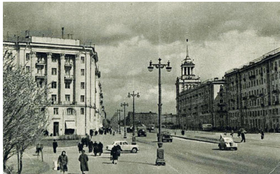
Московский проспект. 1959 г.

Формирование Московского проспекта продолжалось в XX веке. Юридически Москов-