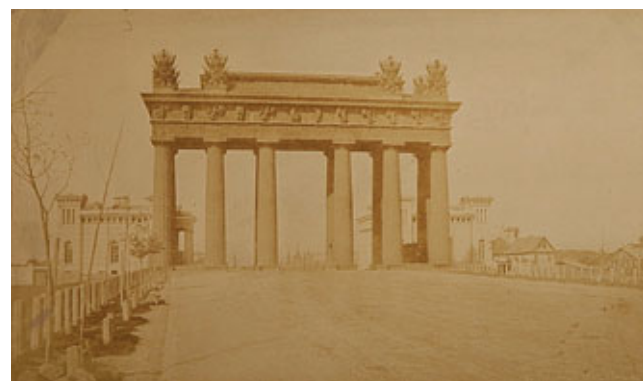
Московские Триумфальные ворота. Альбуминовая печать, 1854. Иван Бианки

Это один из самых молодых по возрасту районов Санкт-Петербурга.