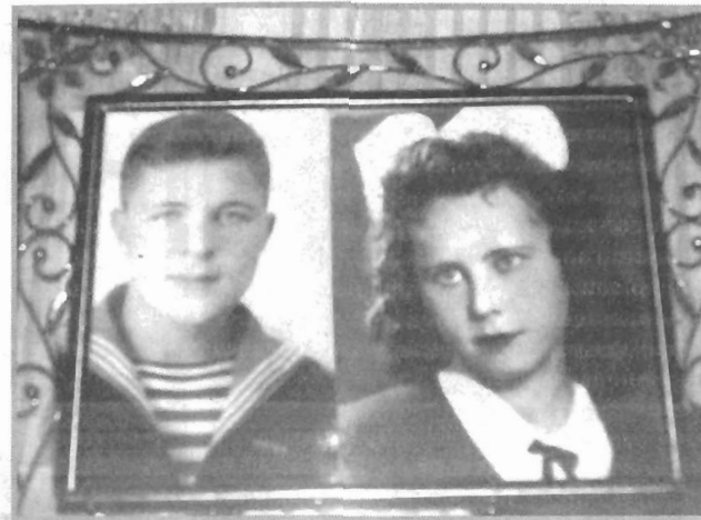
Таким он закончил войну

— Нам сказали, что наша задача сорвать это наступление.