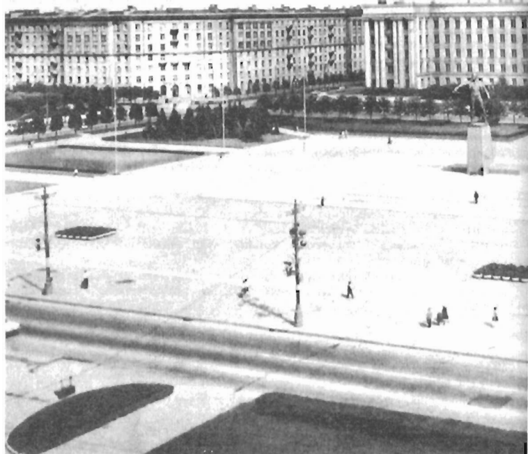
Московская площадь. Дом Советов

Эти работы были завершены уже после войны. Грандиозные масштабы осуществленных Троцким и его коллегами работ впервые выявились в 1994 году, когда было проведено тщательное обследование здания. Здесь, пожалуй, впервые, и не только в нашем городе, но и в стране, с такой убедительностью были сплавлены уроки конструктивизма и творчески освоенного классического наследия. Троцкий целеустремленно и последовательно направил все усилия своего коллектива именно на создание художественного образа общественного здания нового типа, который мог бы стать символом эпохи. Здание отличает мощная пластика, большой ордер, крупные выразительные детали. Вот мнение крупного архитектора Я.О. Рубанчика, современника Троцкого: «Здание воспринимается как яркое индивидуальное творение, проникнутое чертами подлинного