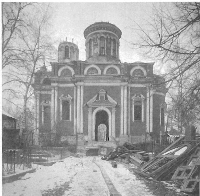
Митрофаниевская церковь во время разборки.

Кладбище было основано в 1831 г. и получило наименование по однопрестольной церкви, построенной в 1839—1847 гг. по проекту К. А. Тона и освященной во имя святого Митрофана Воронежского. Церковь в русско-византийском стиле была копией военного собора в Свеаборге, морской крепости под Гельсингфорсом. Вторая церковь, деревянная, также во имя святого Митрофана, имела