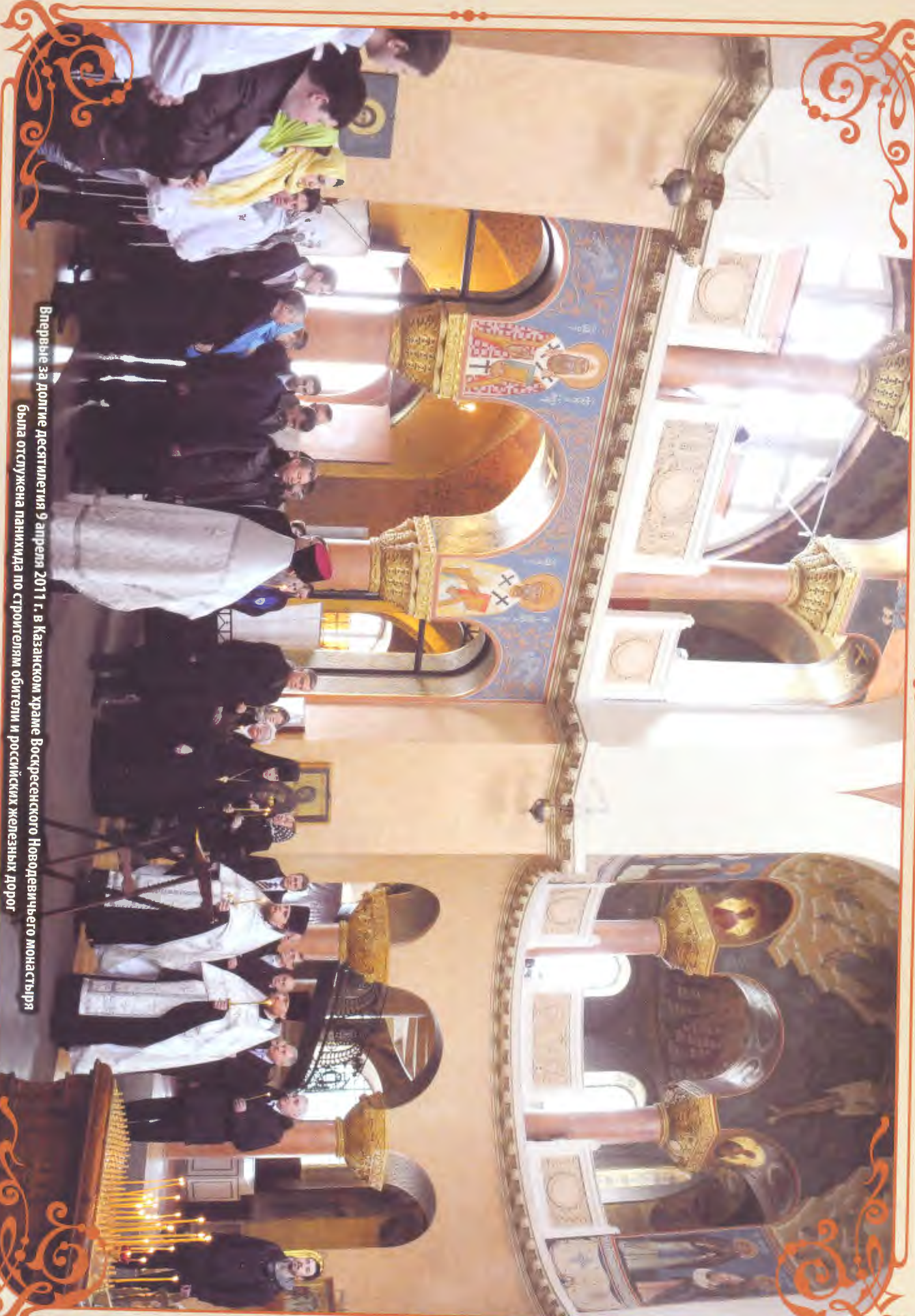
Впервые за Долгие Десятилетия 9 апреля 2011 г. в Казанском храме Воскресенского Новодевичьего монастыря была отслужена панихида по строителям обители и российских железных дорог