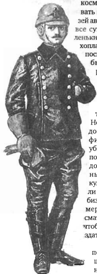
Экипировка первых русских авиаторов.

По нашим планам, и сейчас я уже говорю как председатель секции истории авиации и