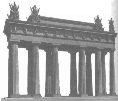
Московские триумфальные ворота

С каждой из рогаток связаны свои мифы, приметы, были и небылицы, что неудивительно.