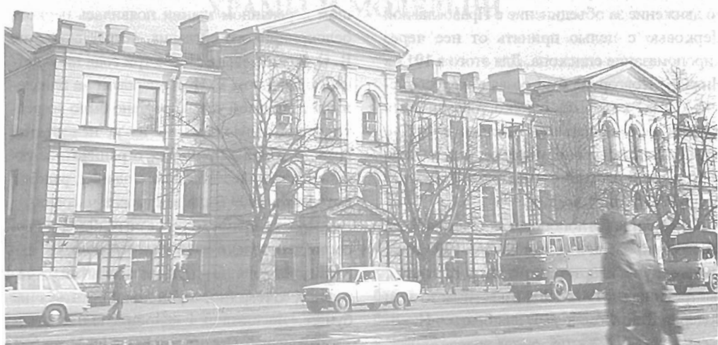
Чубыкинская богадельня. Современный снимок