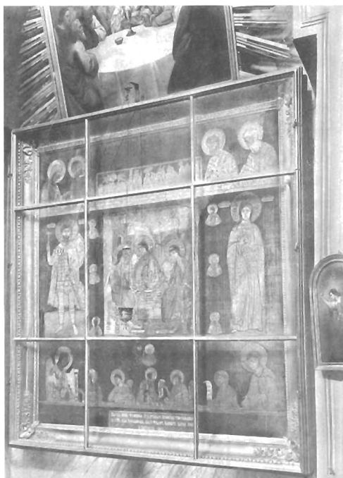
Шитые иконы из Чесменской богадельни

До появления железной дороги в храме богадельни устанавливали перед въездом в