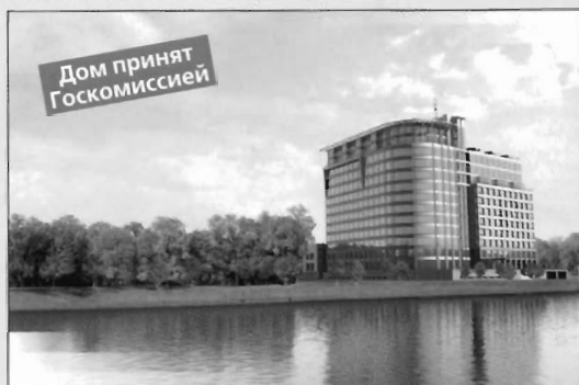
Санкт-Петербург, Песочная набережная, дом 14

с исключительными возможностями для отдыха и спорта