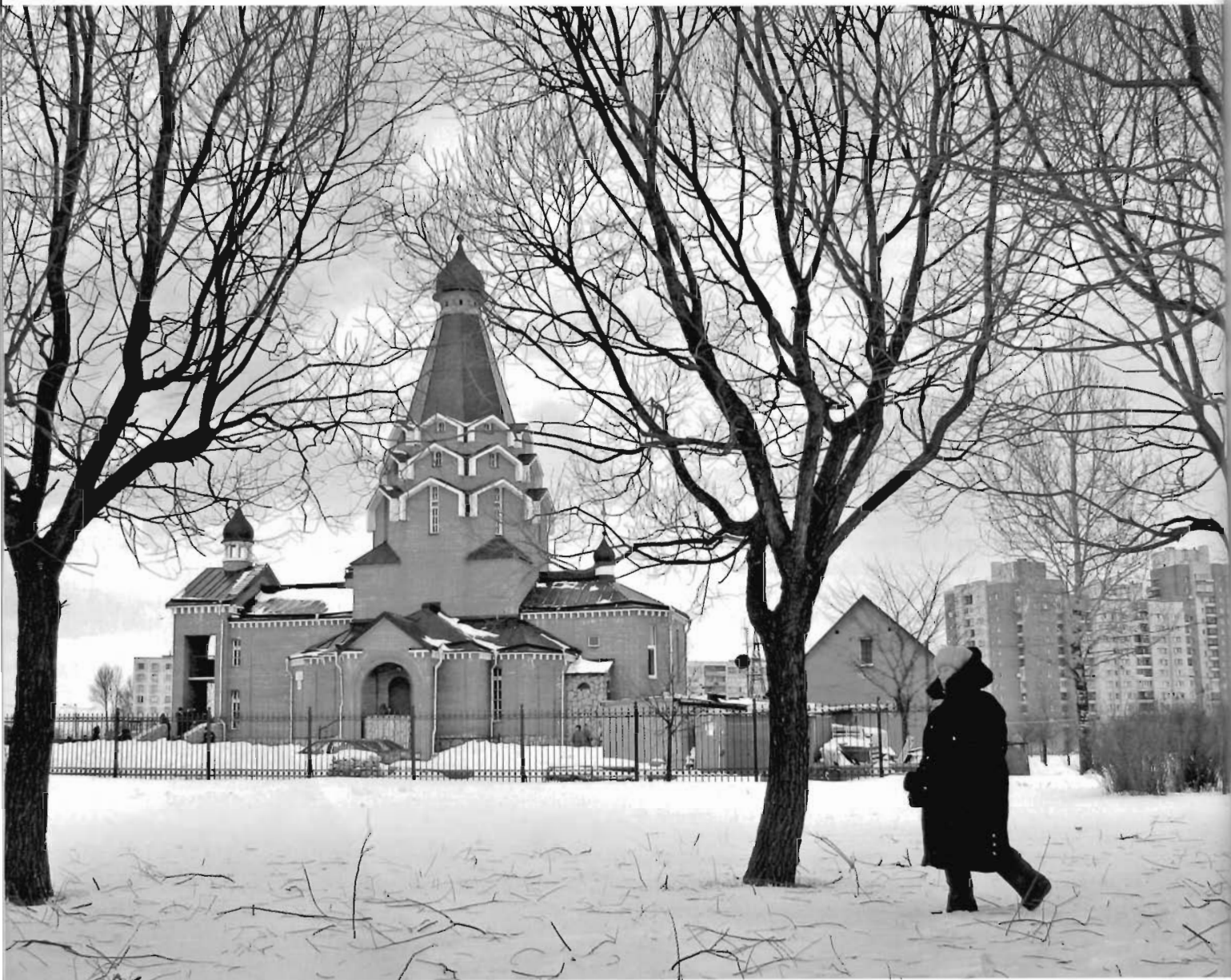
Храм Георгия Победоносца на проспекте Славы.

Храм Иоанна Кронштадтского и выглядит не так, как другие церкви. Нет той самой суровости, характерной для