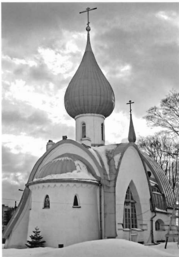
Храм Иоанна Кронштадтского.

многих православных храмов, — все здесь словно приглашает войти. Текущие формы, стрельчатые и полу-круглые окна, изгибы стен, цветовая гамма — все выглядит новым и необычным. И такая архитектура вполне может привлечь прихожан новой формации.