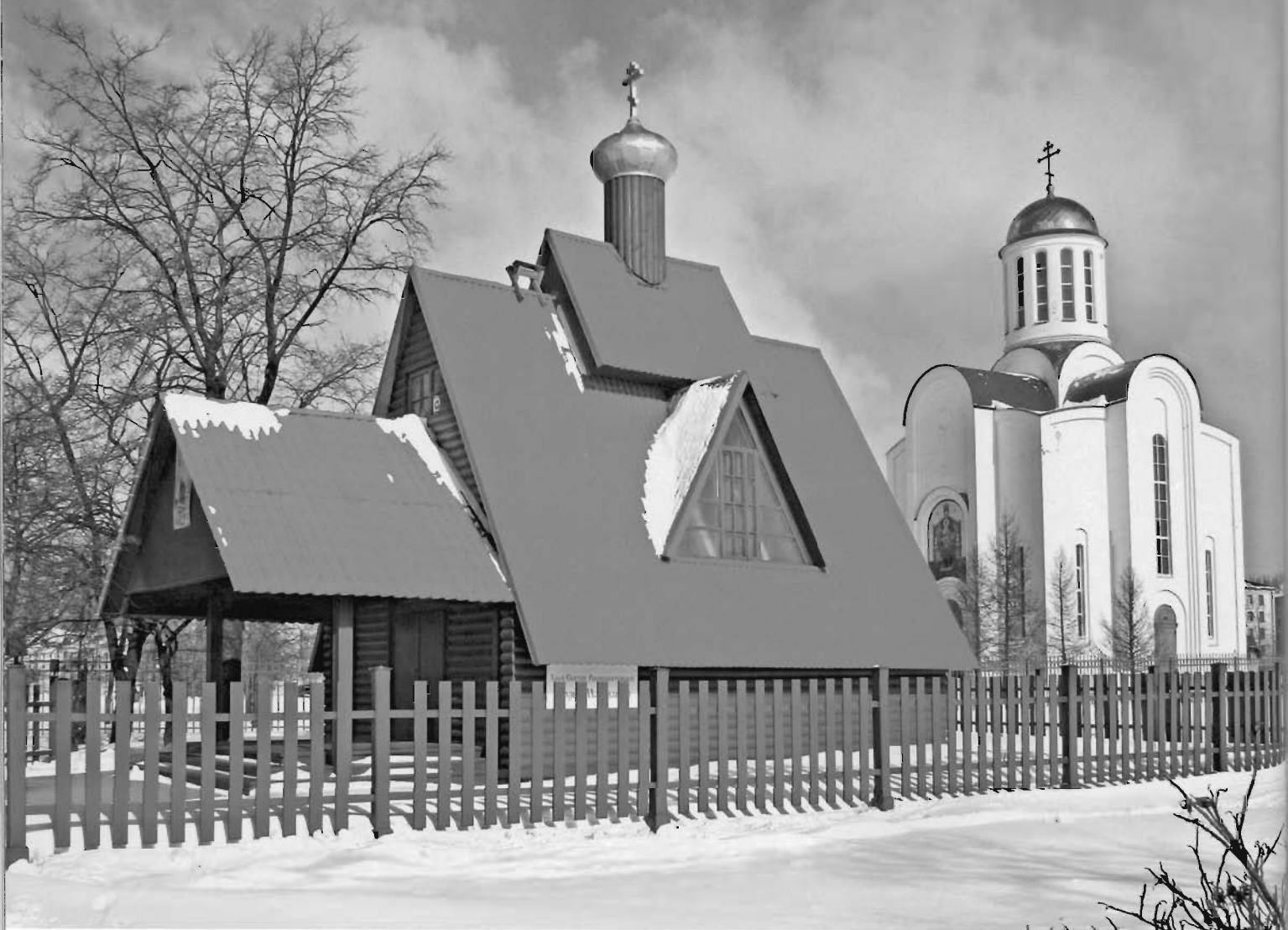
Справа — храм Успения Пресвятой Богородицы на Малой Охте, слева — храм святой равноапостольной Марии Магдалины.