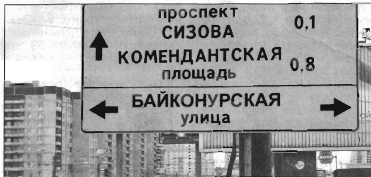
Байконурская улица названа в честь космодрома

Многие улицы и проспекты нашего города получили имена героев космической эры