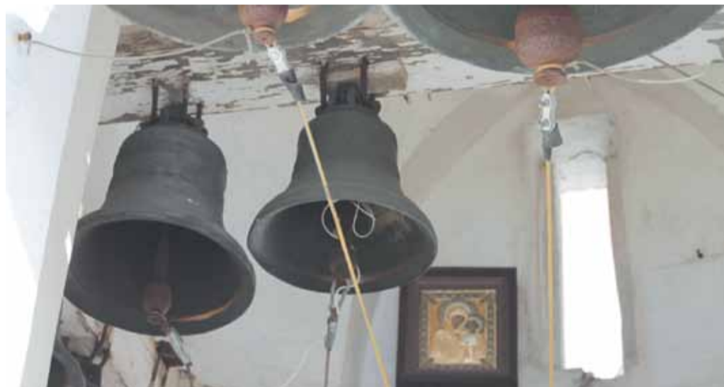
На Чесменской церкви 8 колоколов, на каждом мелом написан номер. А вот сама Светлана Николаевна фотографироваться отказалась