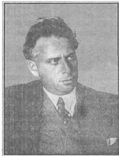
Н. А. Трощкий

Ведущего представителя «символического романтизма» в архитектуре Ноя Абрамовича Трощкого (1895–1940), зодчего, который даже в то богатое талантами время (1930-е гг.) выделялся мощной индивидуальностью, темпераментом, страстью к неустанным поискам новых образов и форм. Это был яркий мастер поколения, духовным вождем которого был В. В. Маяковский.