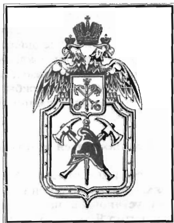
Герб пожарных Санкт-Петербурга

Мужество пожарных было у всех на виду. Об их стойкости и отваге знали далеко за пределами Ленинграда. Родина по достоинству оценила их подвиг: в июле 1942 г. был опубликован указ Президиума Верховного Совета СССР о награждении городской пожарной охраны орденом Ленина.