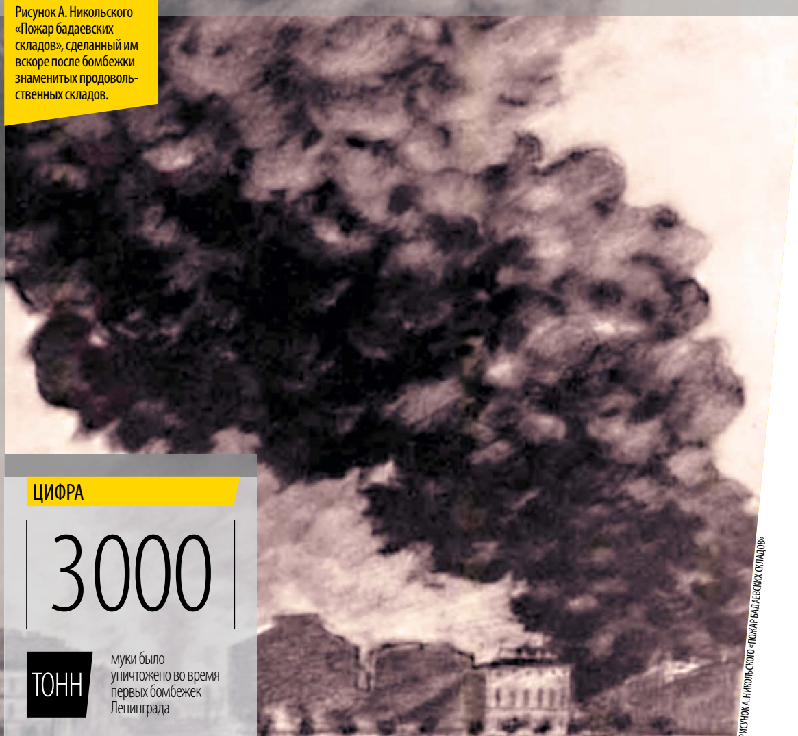
Рисунок А. Никольского «Пожар бадаевских складов», сделанный им вскоре после бомбежки знаменитых продовольственных складов.

Споры вокруг причин катастрофического голода в осажденном Ленинграде не прекращаются до сих пор. Одна из связанных с этим загадок – пожар на Бадаевских складах, где хранились крупные запасы продовольствия.