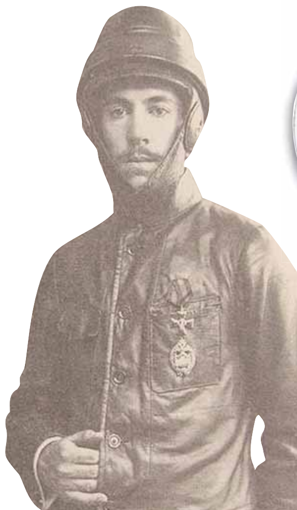
■ Историческая фотография Игоря Сикорского, сделанная знаменитым фотомастером Карлом Буллой в 1914 г.