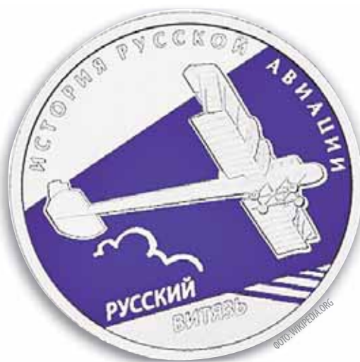
Монета Банка России. Серия «История русской авиации»