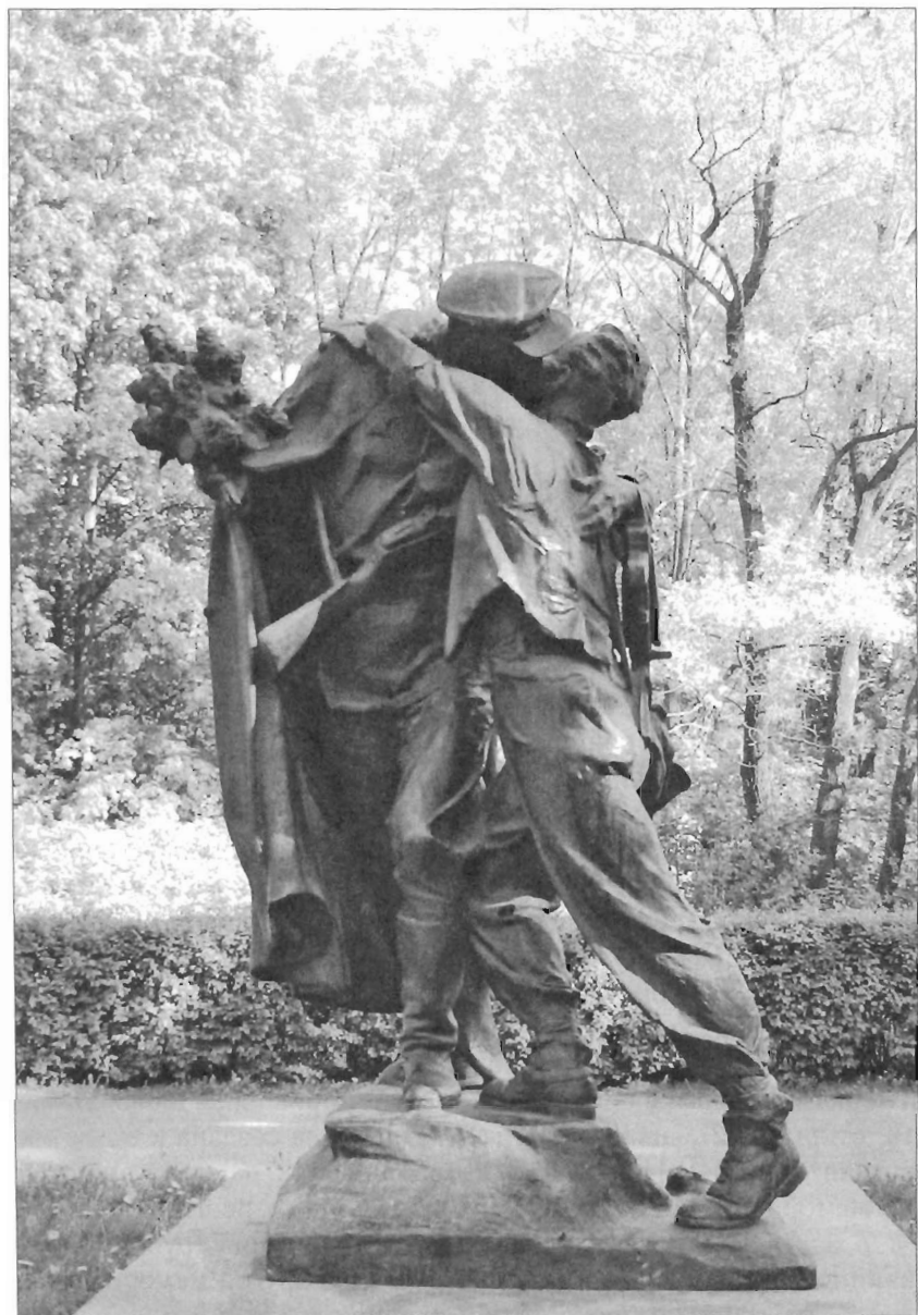
Московский парк Победы. Скульптурная композиция «Братям по оружию» Современная фотография