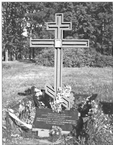
Московский парк Победы. Поклонный крест Современная фотография

Ижорского завода. Это-то и подтолкнуло исполнительную власть Ленинграда организовать кремацию в самом городе, также испытывавшему огромные проблемы с захоронением жертв блокады. Был предложен 1-й кирпичный завод Управления промышленности строительных материалов (адрес — Московское шоссе, д. 8). 15 марта 1942 года на заводе был запущен «...Невиданный в истории и во всем мире крематорий, рожденный мыслью пофронтовому работавших людей, блокадой и тяжелой обстановкой, в которой находился тогда наш город». В качестве топлива использовали дрова и сланец.