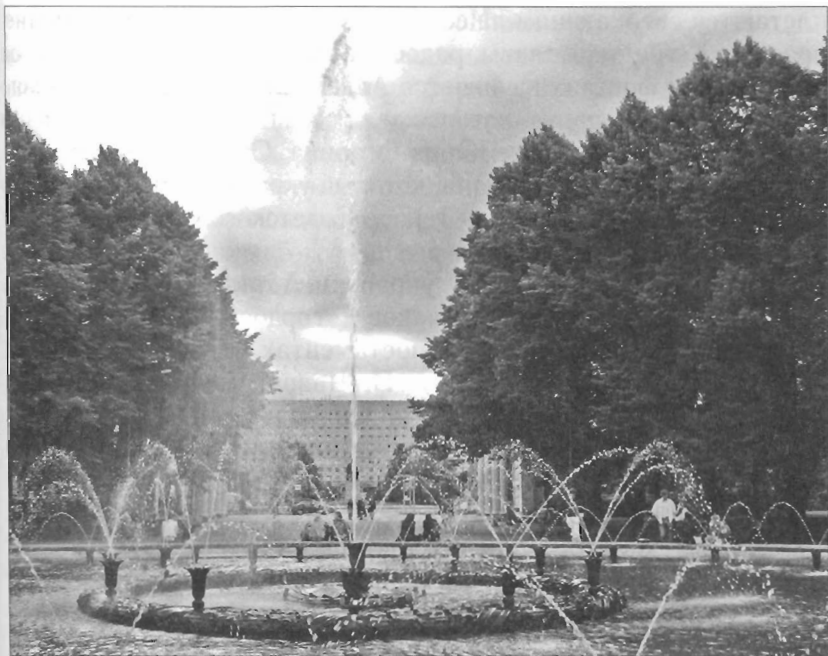
Московский парк Победы. Фонтан «Венок Славы» Современная фотография

Парадный вход в Московский парк Победы решен в виде пропиленов — двух портиков с четырьмя колоннами. Внутренняя сторона этих сооружений украшена шестью композициями из бронзы, посвященными подвигу воинов и тружеников тыла. В них тексты: «Парк Победы создан трудящимися города Ленина как символ вечной славы, как народный памятник Воинам-Героям» и «Парк Победы создан трудящимися города Ленина как символ вечной славы, как живой памятник Народу-Герою» . В самом начале центральной аллеи, сразу за парадным входом со стороны Московского проспекта, установлен один из величественных городских фонтанов «Венок * Славы» — один из самых высоких фонтанов города — высота его центральной струи достигает 12-ти метров. Центральную часть фонтана окружают 20 водометов, по периметру круглого бассейна расположены еще 24 тюльпана-насадки, чьи струи пере-