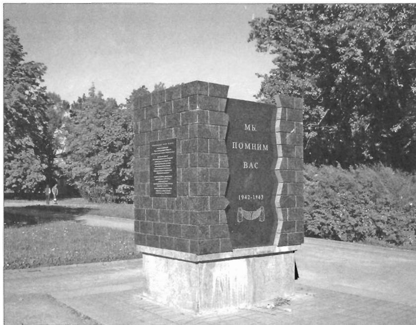
Московский парк Победы. Памятный знак на аллее Памяти Современная фотография

оборудованного в период блокады Кирпичного завода № 1, на месте погребения праха которых сооружены павильон Памяти и памятный знак „Вагонетка“».