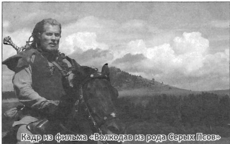
Кадр из фильма «Волкодав из рода Серых Псов»

Полную версию интервью читайте на сайте www.mo47.spb.ru