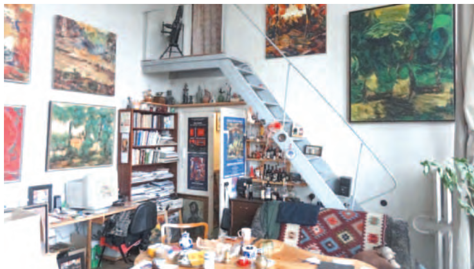
Высота потолков в мастерской — 4,5 метра