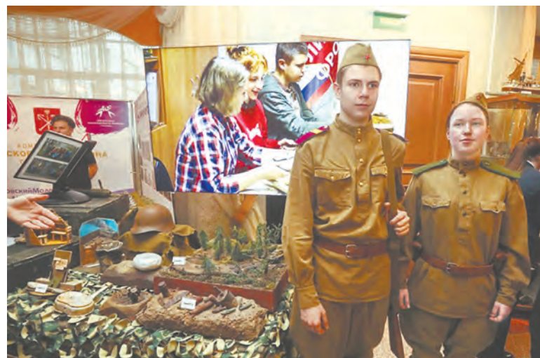
Поисковый отряд Дома молодежи «Пулковец» «Линия фронта» показал подборку находок, сделанных волонтерами на местах боев

Глава администрации отметил, что оборот организаций района увеличился почти на 13% и составил 844 млрд рублей.