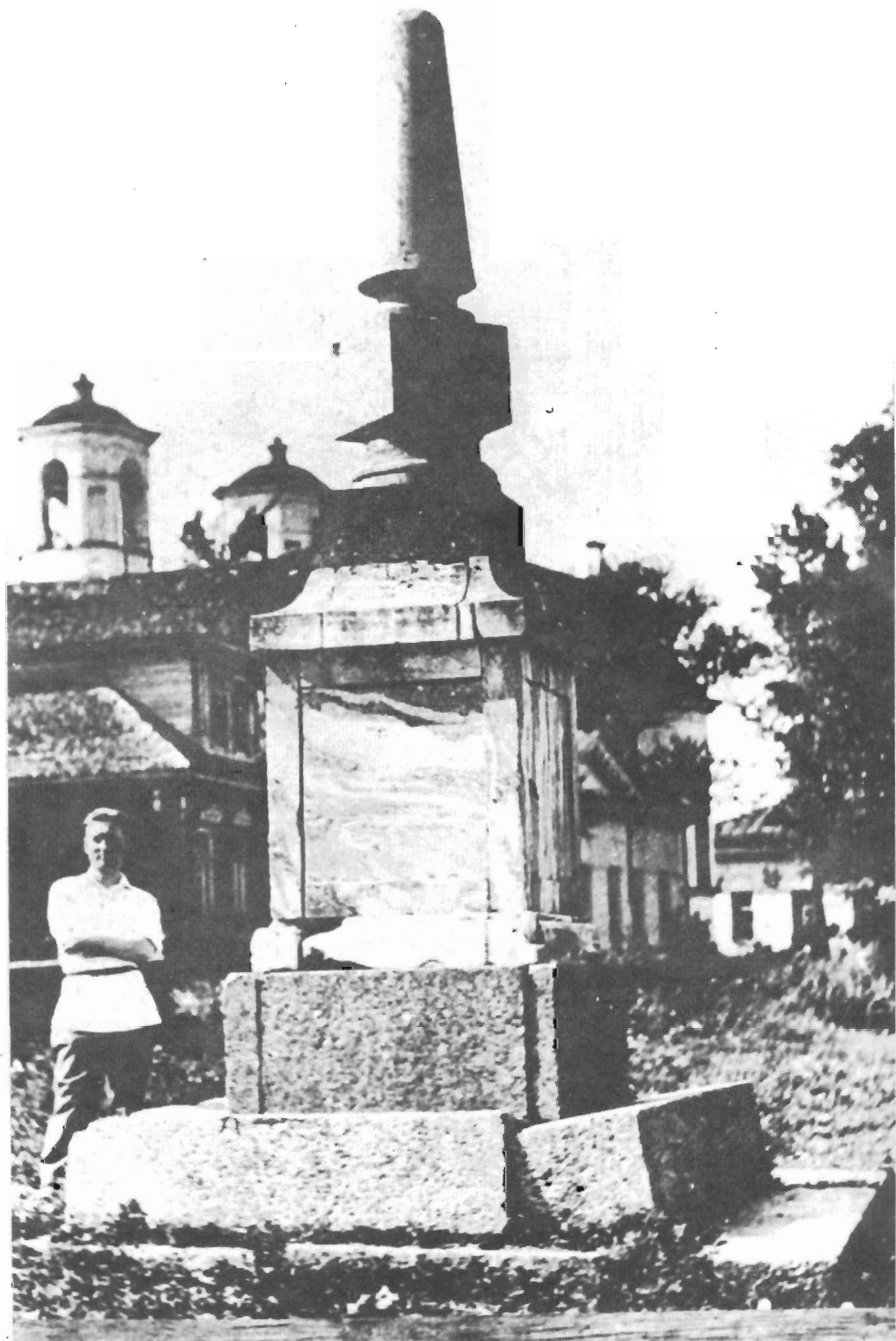
Верстовой столб в селе Пулково. Фото 1939 года