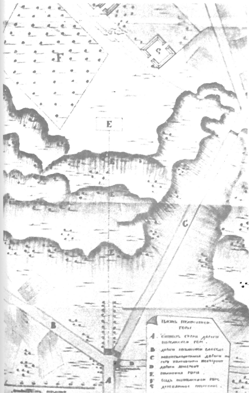
План Пулковской горы. 1754 год