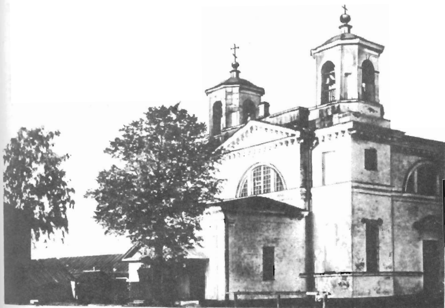
Церковь Смоленской Божьей Матери в селе Пулково. Фото конца 1930-х годов