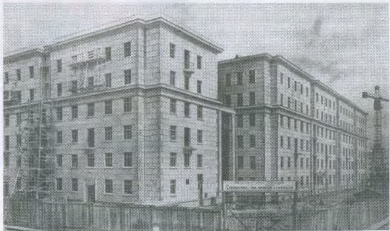
1949-й. Завершение строительства дома № 27 на ул. Свеаборгской (слева). А дома 48 по ул. Кузнецовской ещё нет.

запасов скатов в воздухе. Утром лодка становилась похожа на айсберг, и приходилось постоянно скалывать лёд. Дважды в ледяной воде при штормовом ветре проводили ремонтные работы. Проектная автономность «Щук» была определена в 20 суток. «Щ-117» пробыла в автономном плавании в два раза больше. Попутно был установлен и ещё один рекорд – в подводном положении на ходу без всплытия лодка провела 340 минут 35 секунд.