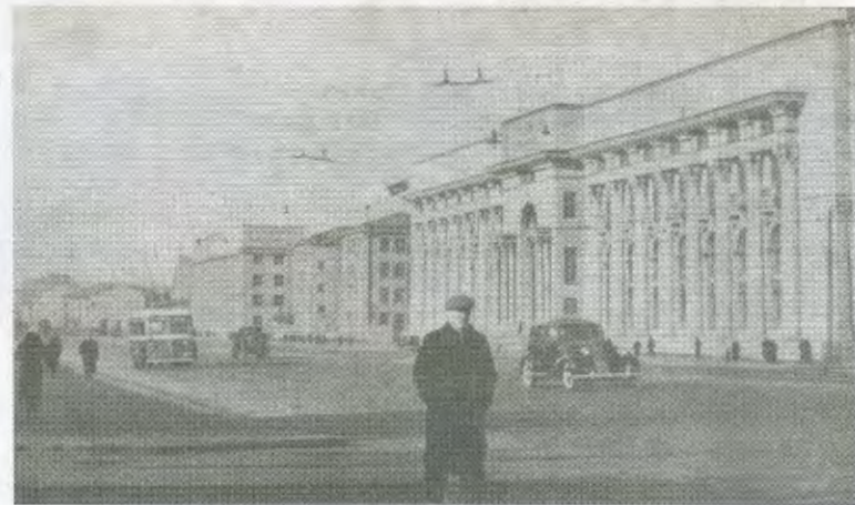
Дом «Союзпушнина» на Международном проспекте. 1941 год.

Общий размер книги 26 x 34 см, 403 страницы. Бумага мелованная,