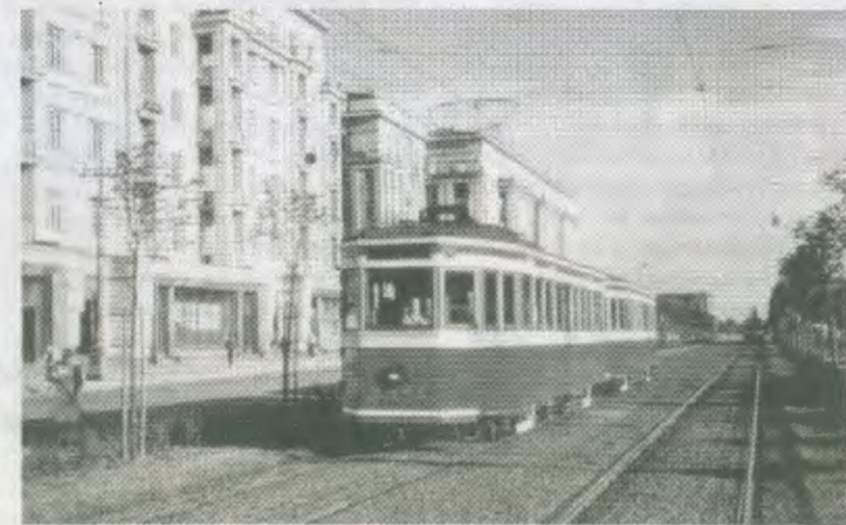
Вдоль по Московскому проспекту. Фото 1959 года.

Впрочем, война внесла свои коррективы. Решение о переносе центра было признано необо-