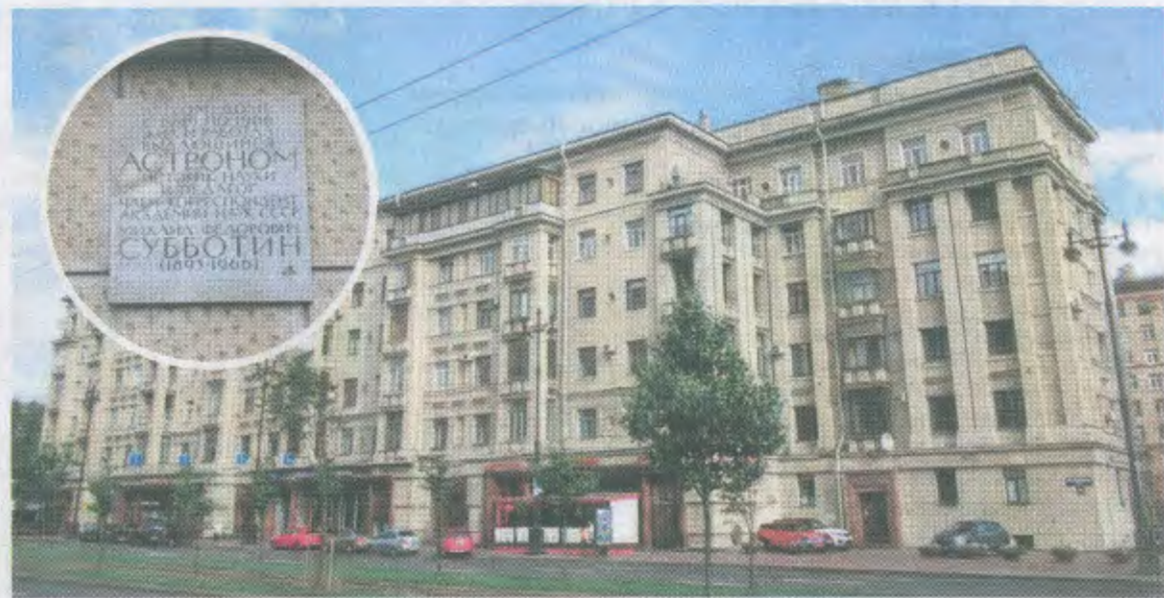
В доме № 206 с 1949 по 1966 годы жил и работал астроном, историк и педагог, основатель ленинградской школы небесных механиков, член-корреспондент Академии наук СССР Михаил Фёдорович Субботин.

Дома Ленсовета или же дома работников Дома Советов – именно так называют их в народе. Потому как предназначались они для работников Дома Советов на Московской площади, куда предполагалось перенести центр Ленинграда, и где бы разместился