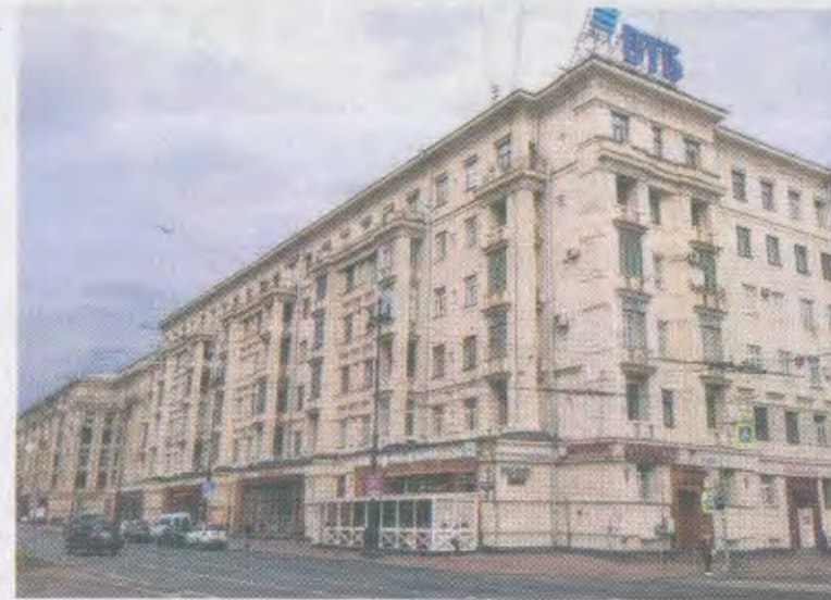
Богато украшенные лепниной, с витринами и парадными, отделанными красным гранитом, и с ризалитами, эти дома как образец сталинского ампира и тех самых «архитектурных излишеств» – с 1940 года украшают Московский проспект.