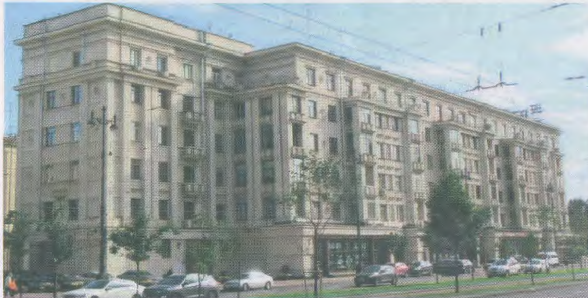
В этом доме № 208 с 1948 по 1967 годы жил и работал писатель, публицист и путешественник Иван Сергеевич Соколов-Микитов.