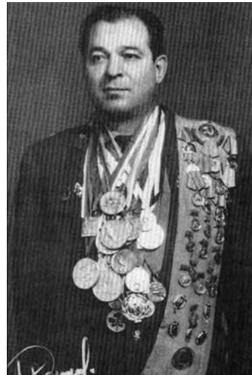
Анатолий Роцин – Роцин – олимпийский чемпион, трёхкратный чемпион мира по классической борьбе, чемпион Европы, четырёхкратный чемпион СССР, трёхкратный чемпион Спартакиад народов СССР, двукратный чемпион СССР по самбо.

«На ковре ты реализовал себя, показал, что ты можешь сделать, и от этого получаешь удовольствие. Помню, однажды мы собрались пойти небольшой компанией в театр, а у меня соревнования... Пришли в зал моя жена, приятель со своей женой, и я им говорю: «Сейчас я схватку отработаю, постараюсь побы-