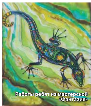
Работы ребят из мастерской «Фантазия»