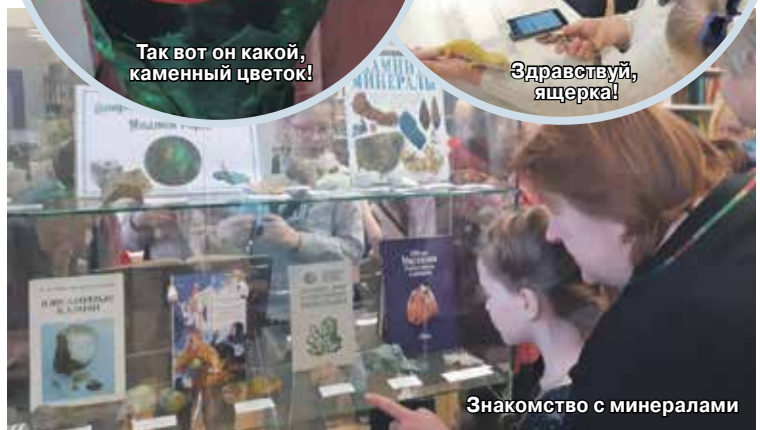
Знакомство с минералами