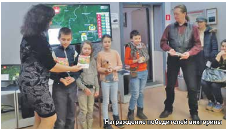
Награждение победителей викторины

Всё это происходило в конференц-зале. Много интересного ждало детей и взрослых и в других помещениях библиотеки.