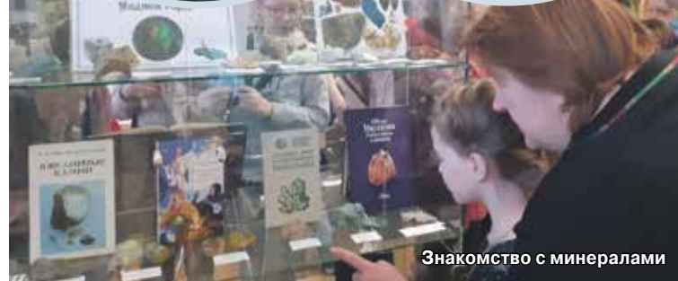
Знакомство с минералами