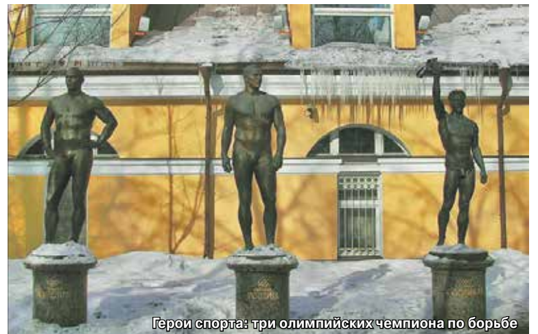
Герои спорта: три олимпийских чемпиона по борьбе