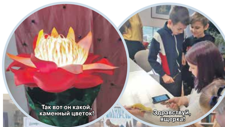
Так вот он какой, каменный цветок!