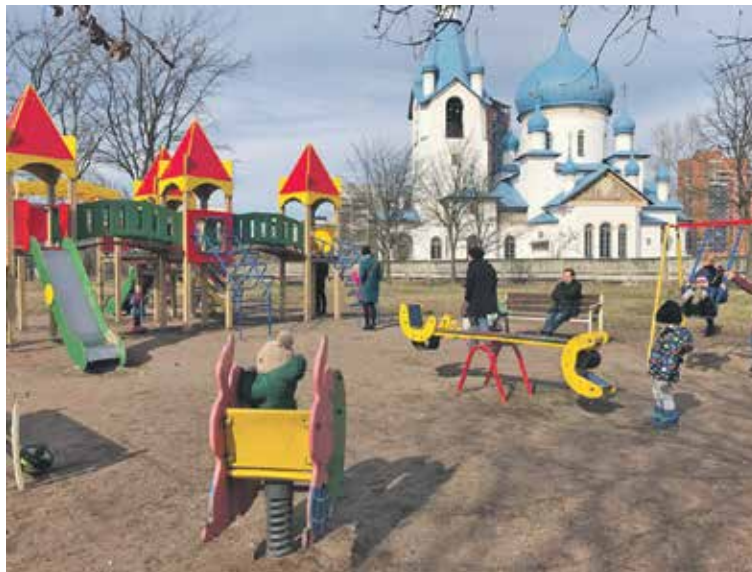
Старое игровое оборудование и песок, в котором вязнут колеса колясок. Такой была единственная детская игровая площадка в Пулковском парке до лета 2019-го. Сейчас площадка демонтирована. Идут работы по освещению парка. До 15 октября здесь будет создано новое игровое пространство, которое подойдет всем детям независимо от их физических возможностей.

В 2019 году в конкурсе «Твой бюджет» было поддержано три инициативы жителей Московского района. Помимо площадки для маломобильных детей, будут установлены перехватывающие велопарковки у метро и благоустроен сад Дубовая роща. Авторы этих проектов – Семен Белугин и Кирилл Гладкий.