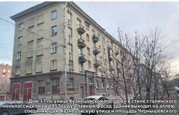
Дом 17 по улице Кузнецовской построен в стиле сталинского неоклассицизма в 1953 году. Главный фасад здания выходит на аллею, соединяющую Кузнецовскую улицу и площадь Чернышевского