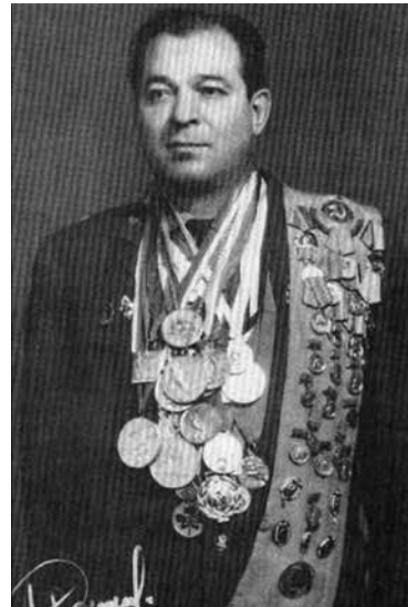
Анатолий Роцин – Роцин – олимпийский чемпион, трёхкратный чемпион мира по классической борьбе, чемпион Европы, четырехкратный чемпион СССР, трехкратный чемпион Спартакиад народов СССР, двукратный чемпион СССР по самбо.

«На ковре ты реализовал себя, показал, что ты можешь сделать, и от этого получаешь удовольствие. Помню, однажды мы собрались пойти небольшой компанией в театр, а у меня соревнования... Пришли в зал моя жена, приятель со своей женой, и я им говорю: «Сейчас я схватку отработаю, постараюсь побы-