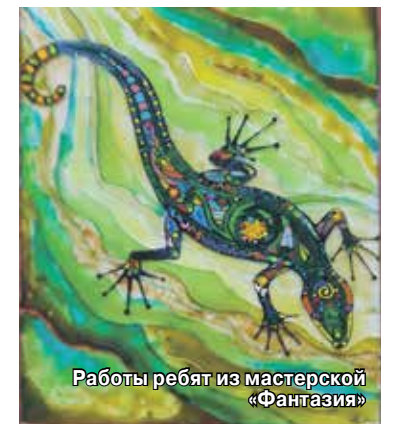
Работы ребят из мастерской «Фантазия»