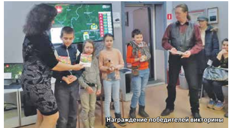
Награждение победителей викторины

Всё это происходило в конференц-зале. Много интересного ждало детей и взрослых и в других помещениях библиотеки.