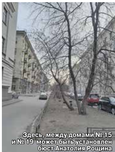
Здесь, между домами № 15 и № 19 может быть установлен бюст Анатолия Роцина