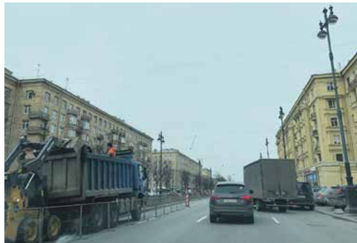
На Московском проспекте от набережной Обводного канала до площади Победы появятся 335 современных опор с 670 светильниками.

Модернизация освещения завершится заменой осветительного оборудования с энергозатратного на светодиодное на крышах 22-этажных домов рядом с монументом (Московский пр., 207 и 224), которые визуализируют российский триколор.