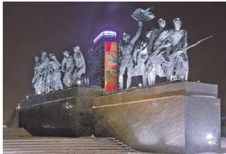
К 75-й годовщине Победы в Великой Отечественной войне в Петербурге обновят художественную подсветку Монумента героическим защитникам Ленинграда.