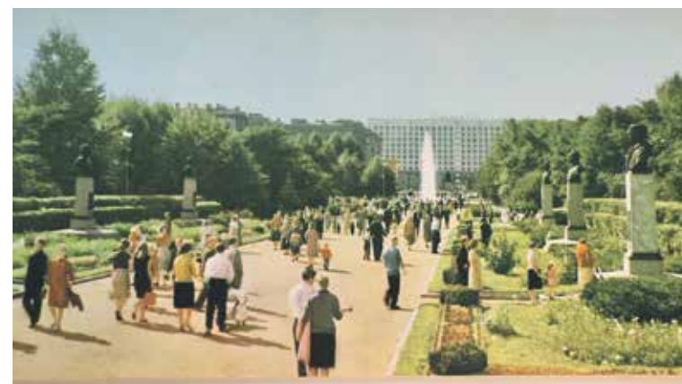
Аллея Героев в парке 50 лет назад.

Фонтан «Венок Славы» – объект культурного наследия федерального значения. И прежде чем приступить к реконструкции, была проведена экспертная оценка объекта, чтобы в ходе реконструкции не повредить исторически значимые части памятника.