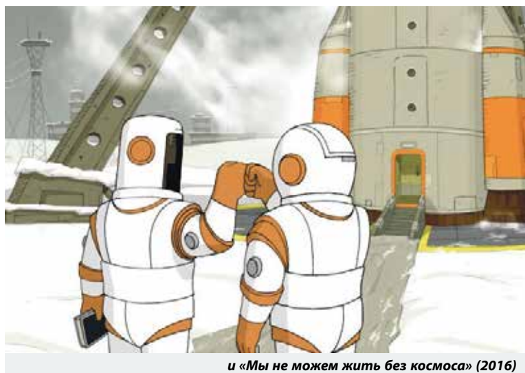
и «Мы не можем жить без космоса» (2016)