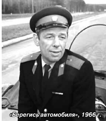
«Берегись автомобиля», 1966 г.

Этот фильм был учебным пособием при подготовке кадров для КГБ. Сотрудники госбезопасности были консультантами фильма: они открывали доступ ко многим объектам, где работала съёмочная