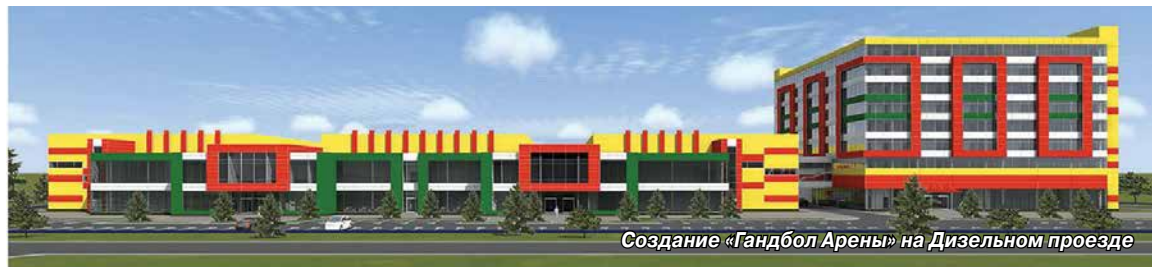
Создание «Гандбол Арены» на Дизельном проезде

Кстати, тематические проекты парком аттракционов не ограничиваются. В районе Пулковского шоссе, на пока еще свободной территории бывшего предприятия «Лето», планируется строительство гостиничного комплекса , который будет выполнен в виде средневекового города-крепости. Кроме того, что это, как минимум, необычно и привлекательно, комплекс должен стать настоящим прибежищем для набравшего большую популярность движения по реконструкции исторических событий.