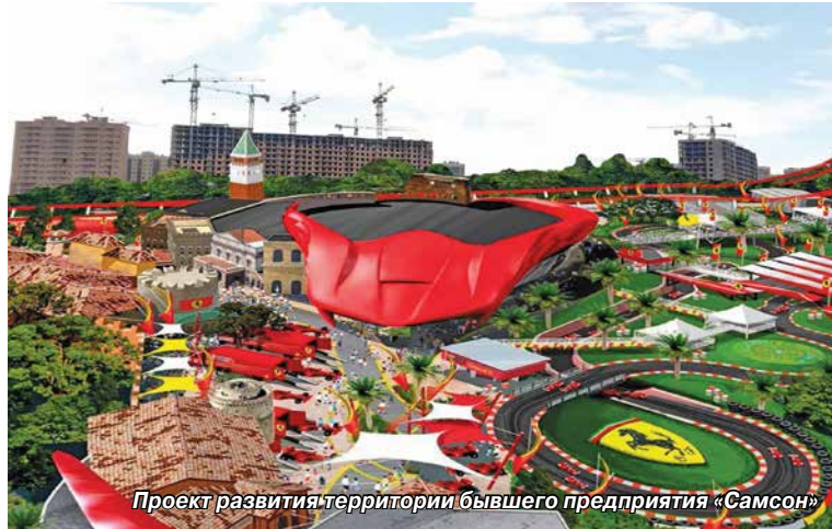
Проект развития территории бывшего предприятия «Самсон»

Впрочем, данный проект особо и не обсуждался. Дело в том, что строительство храма предполагается на частные деньги, а от районных властей нужна лишь административная поддержка. К тому же общественникам явно польстило то, что Храм «Раха» должен стать первым в России.