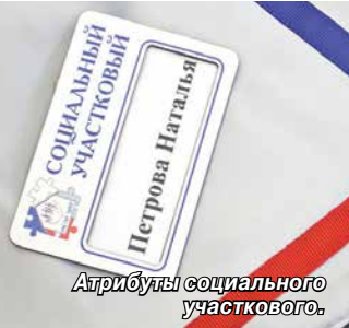
Атрибуты социального участкового.