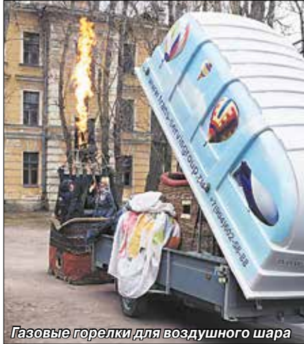
Газовые горелки для воздушного шара

Офицерская воздухоплавательная школа – одна из достопримечательностей Московского района. Проезжая на электричке станцию "Воздухоплавательный парк", не все задумываются, что именно здесь началась история военно-воздушного флота России. Сегодня мы рассказываем о человеке, который организовывал полеты на аэростатах и под руководством которого был построен первый русский дирижабль.