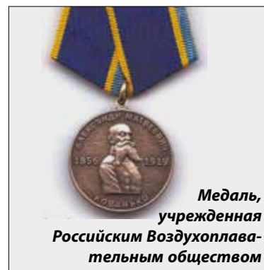
Медаль, учрежденная Российским Воздухоплавательным обществом

Матвеевиче. Она упомянула, что Кованько знал много языков, был настоящим полиглотом. Также она продемонстрировала некоторые рисунки Александра Матвеевича, ведь он еще и рисовал. Среди рисунков были натюрморт, южный пейзаж.