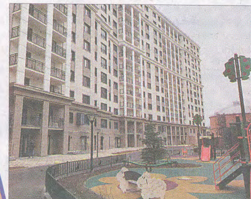
ЖК «Богемия», Смоленская ул., д. 14, литера А