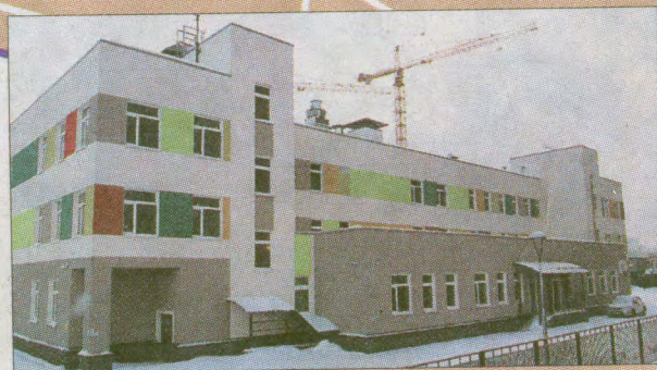
Детский сад на 140 мест пр. Космонавтов 102, корп.2 стр.1