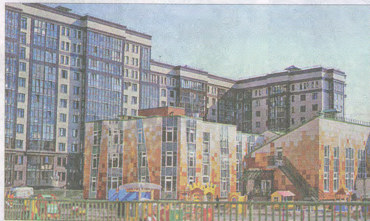
Детский сад на 220 мест, Заставская улица, д. 44, корпус 2