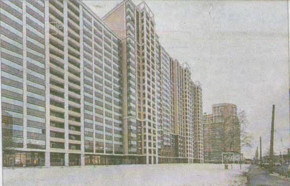
ЖК «Москва», ул. Костюшко, д. 19, литера А