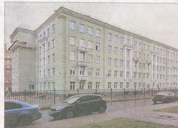
Поликлиника Северо-Западного таможенного управления, Московский пр, д.141