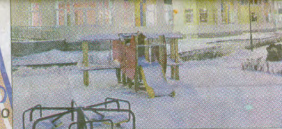
Детский сад на 300 мест, Среднерогатская улица, д. 13, корпус 3