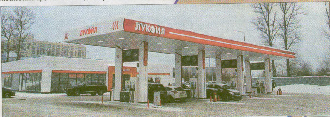
Автозаправка Пулковское шоссе, д. 42, корпус 5