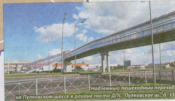
Надземный пешеходный переход на Пулковском шоссе в районе поста ДПС, Пулковское ш., д. 35