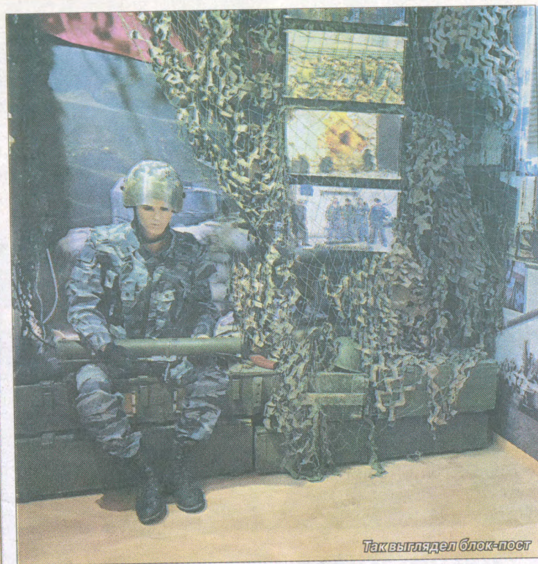
Так выглядел блок-пост