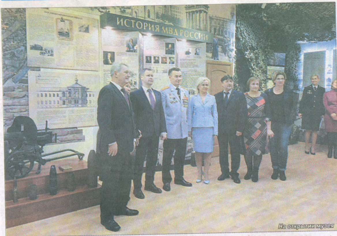
На открытии музея

В рубрике «Добро пожаловать!» мы продолжаем знакомить читателей с интересными местами Московского района, куда не так просто попасть. В частности, с ведомственными музеями.