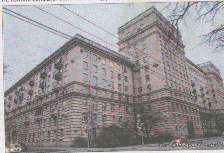
ул. Кузнецовская, д. 44

Написать частушки на заданные темы для авторов-профессионалов было делом техники. Нетрудно было и Рудакову с Нечаевым наклеить листочки с частушками на гитару и концертину и поражать своей оперативностью притомившегося от