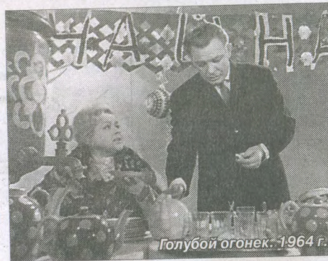
Голубой огонек. 1964 г.

В эпоху раскочеривания всех секретов откроем и этот: писали те сверхзлободневные частушки мы, и не за 15 минут до концерта, а часа за два до начала совещания. Лидеры той поры читали свои речи, как правило, по бумажке. Копии этих бумажек заранее получала министр культуры Фурцева, передавала их со