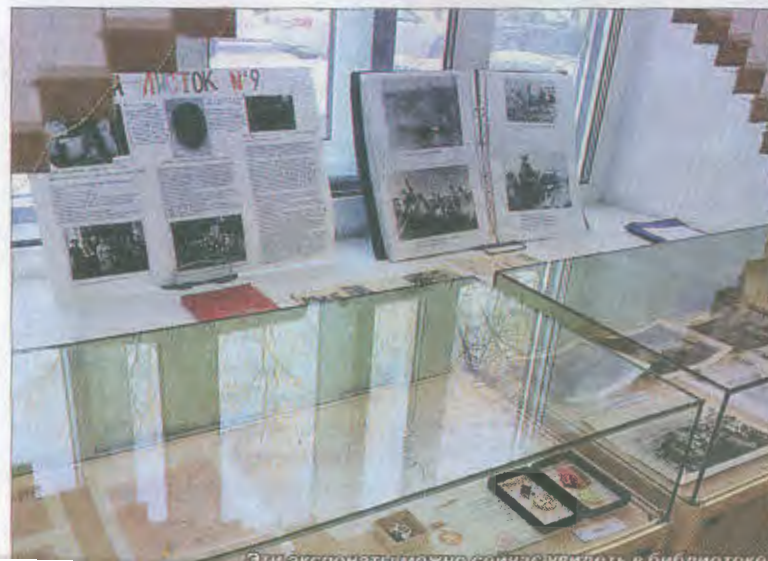
Эти экспонаты можно сейчас увидеть в библиотеке