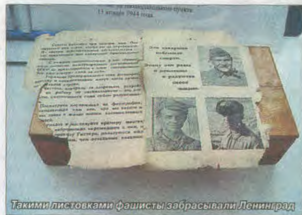
Таковыми листовками фашисты забрасывали Ленинград