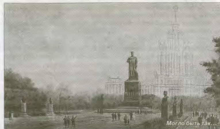
Могло быть так...