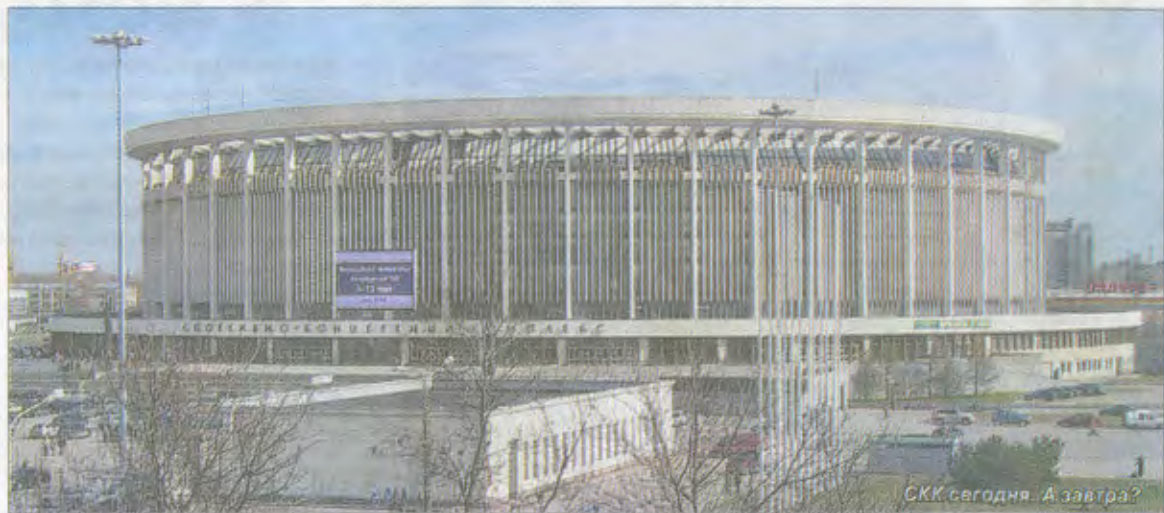
СКК сегодня. А завтра?

используют повсеместно при строительстве спортивных объектов, а рядом, на углу Гагарина и Кузнецовской, стояли так называемые «корпуса» – двухэтажные блочные бараки, в которых жили рабочие завода железобетонных изделий (впоследствии – ДСК-4). За бараками находились сараи, где держали скотину.