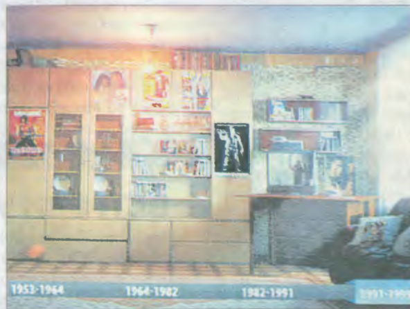
Коллекция олимпийского движения – как жили чемпионы