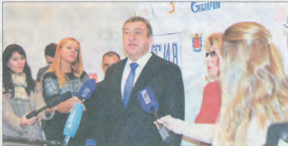
Вице-губернатор Игорь Албин: «Семь месяцев от идеи до её воплощения»

РЕПОРТАЖ ИЗ МУЗЕЯ, В КОТОРОМ ВЫ ЕЩЕ НЕ БЫЛИ