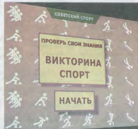
А вы хотите проверить свою эрудицию?