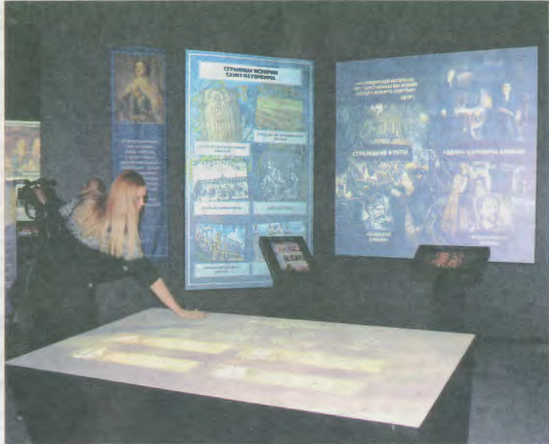
Тронь рукой – и всё увидишь