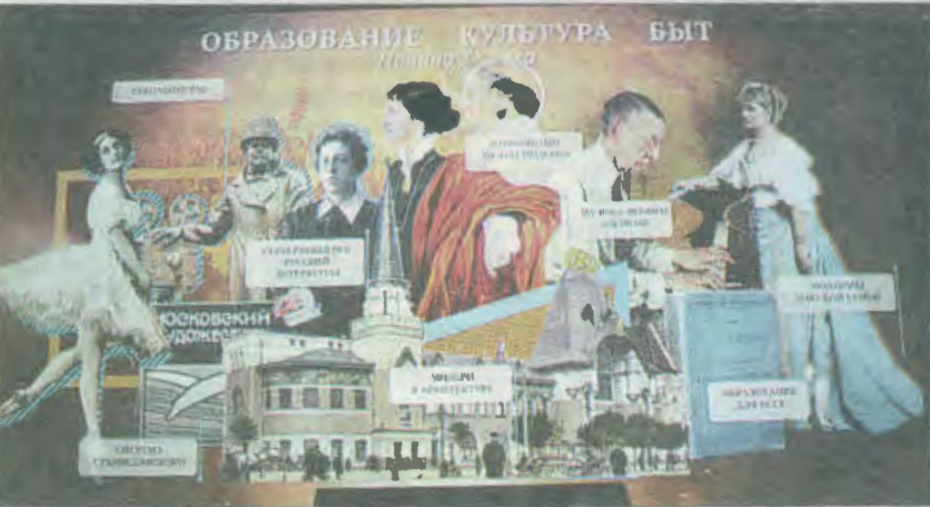
И вот пришел XX век