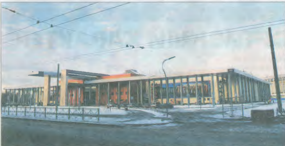
Новая точка на карте города