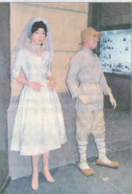
Оставалось два дня: не все фигуры успели разойтись

Новой достопримечательностью города и нашего района станет мультимедийный исторический парк «Россия – моя история».