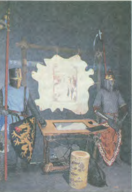
Это было давно