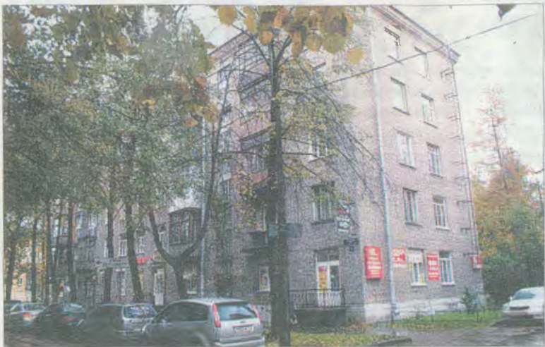
Ул. Алтайская, д. 23