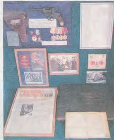
Стенд в Музее железнодорожного транспорта, посвященный П.З. Заварзину