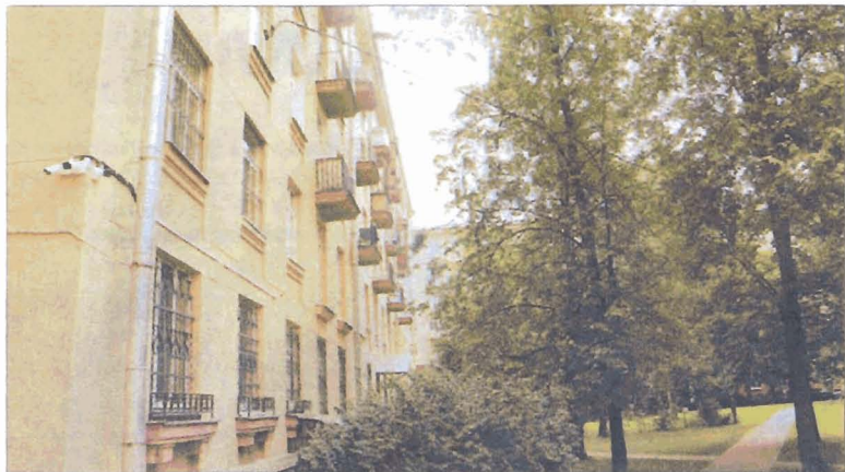
Бассейная ул., д. 57.

Продолжаем рубрику, в которой рассказываем о людях, чья жизнь была связана с Московским районом.