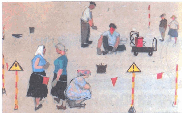
Разметка Московского проспекта