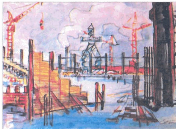
Строительство арены СКК.