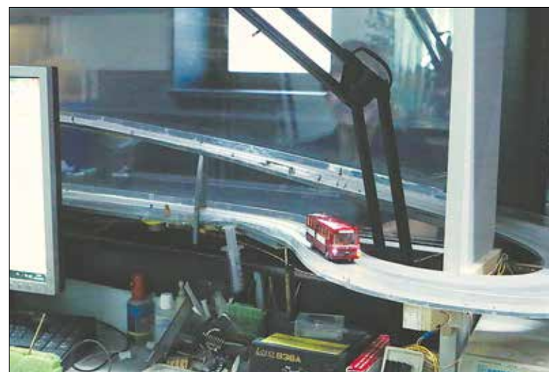
Автобус тестируется в мастерской