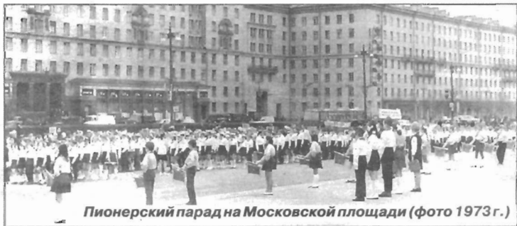
Пионерский парад на Московской площади (фото 1973 г.)

Он очень красив... и очень молод, наш справляющий девяностолетний юбилей самый прекрасный район самого прекрасного города. Будем любить и беречь его, как любили и берегли его наши родители, деды и прадеды.