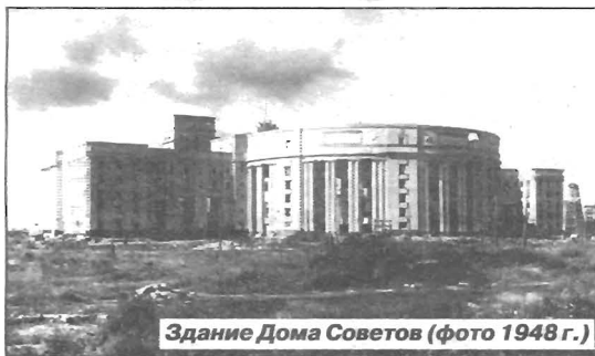
Здание Дома Советов (фото 1948 г.)

В марте 1944 года через два месяца после полного снятия блокады, Государственный комитет обороны принял постановление «О первооче-