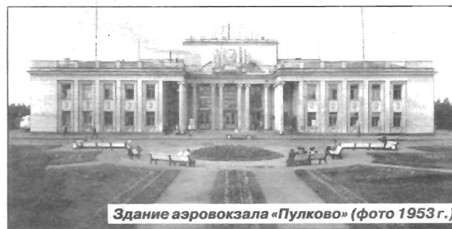
Здание аэровокзала «Пулково» (фото 1953 г.)