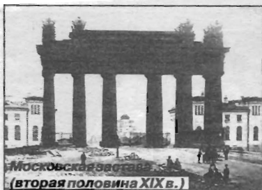
Московская застава (вторая половина XIX в.)