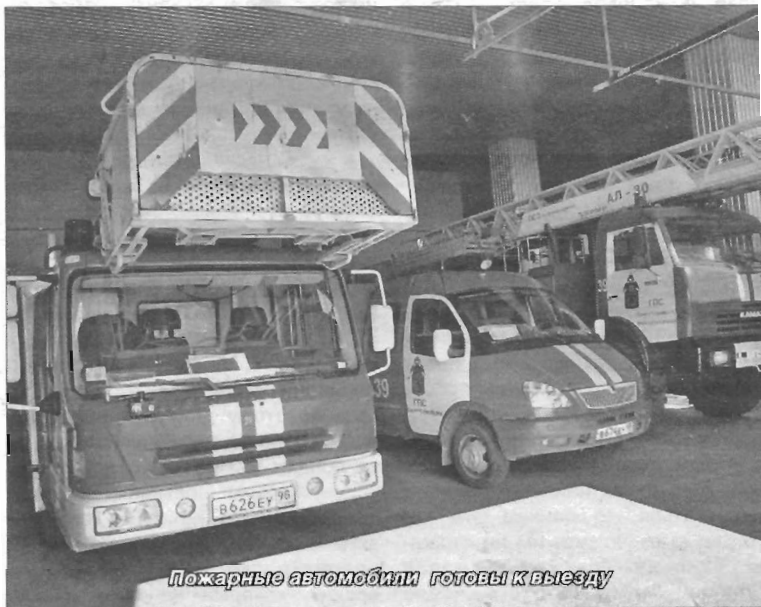
Пожарные автомобили готовы к выезду

Штат 39-й пожарно-спасательной части — 119 человек; из них 37 пожарных, 10 старших пожарных, 20 командиров отделов, 4 начальника караула. Средний возраст — 43 года. Приходит и молодежь. Некоторые новички увольняются через три-четыре месяца — не выдерживают трудностей, экстремальных ситуаций. Тяжело работать в противогазе, в