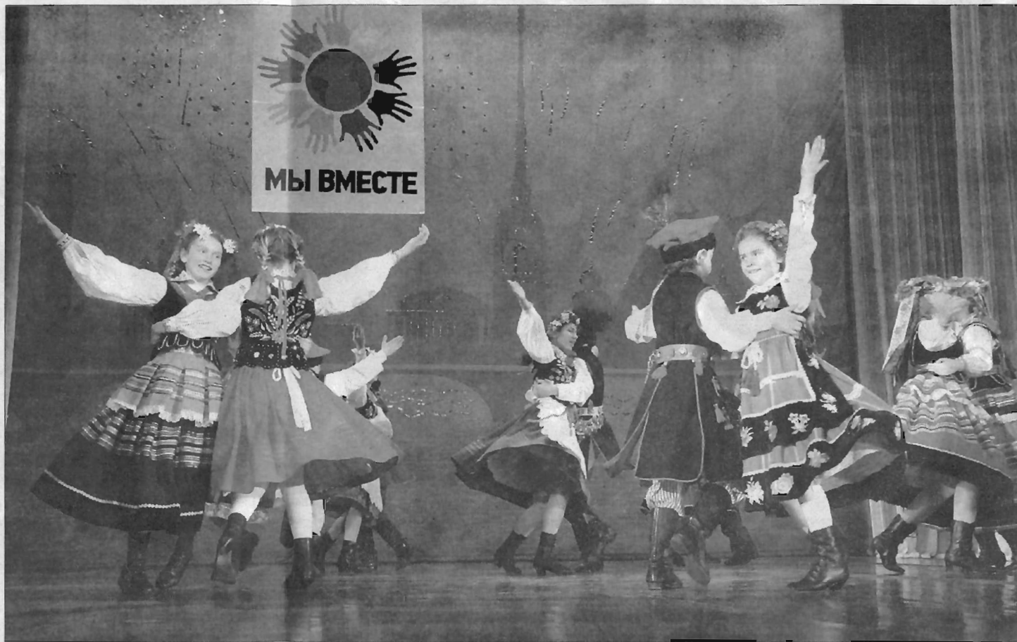
Концерт в честь Дня толерантности в культурно-досуговом центре «Московский»