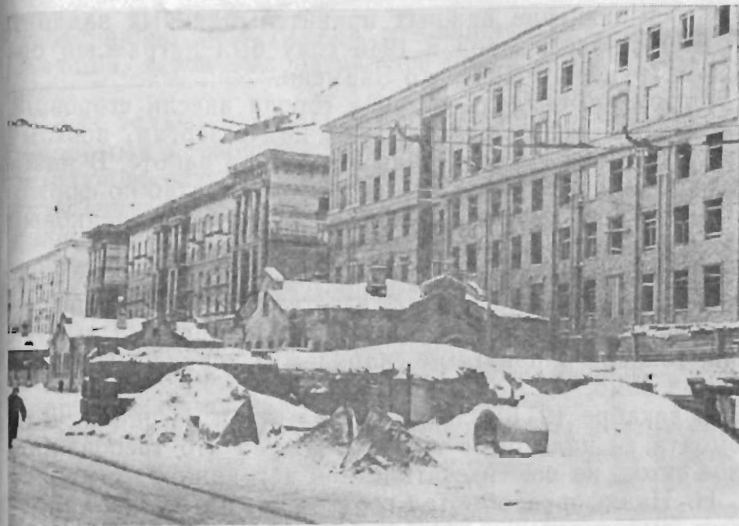
В дни блокады. Южнее «Электросилы».

В январе 1942 года было решено возобновить работу Волховской ГЭС. Туда направили для ремонта рабочих «Электросилы». С 23 сентября 1942 года Ленинград стал получать спасительную энергию.