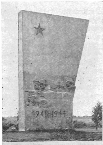
Зеленый пояс Славы. Мемориал «Пулковский рубеж» («Ополченцы»).

«Ополченцы» (6-й километр шоссе Пулково — Пушкин). Здесь в районе бывшего командного пункта одной из рот 189-й стрелковой дивизии трудящиеся Октябрьского района соорудили мемориальный комплекс. Композиционный центр его — монументальная стела, напоминающая развернутое знамя. Динамику сооружения усиливает рельеф,